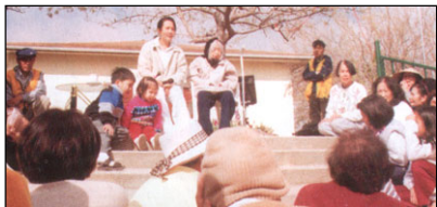
Mistryně se milujícím věnuje starším spoluzasvěceným.

Lidé válčí jeden s druhým, protože se příliš identifikují s jejich těly, s okamžitými potřebami jejich těl, se všemi požadavky jejich těl. Proto zabíjí jeden druhého. Jediné řešení tohoto problému je najít cestu, jak zjistit, že my nejsme naše tělo, a proto nám nikdo neopouje a nejsme v nebezpečí ekonomicky ani politicky. Osvícení je skutečná a trvalá odpověď. Sice budeme pokračovat v identifikaci s našimi těly a snažit se naplňovat jejich potřeby, bez starostí, že jiní lidé přijdou a ukradnou naši úrodu, vezmou si naše ženy nebo napadnou naše národy. Některé národy vedou válku mezi sebou, protože chtějí rozšířit jejich ekonomickou sílu. Aby nakrmily své přelidněné země, bojují, aby získaly více půdy, aby získaly více ekonomického trhu, atd. To všechno má spojitost s tělem. I když říkáme, že to jsou rozdíly v ideálech, vše se to týká požadavků těla. Takže pokud se staneme osvícenými, tyto války přestanou samy o sobě. My skutečně zažijeme bratrství lidstva.