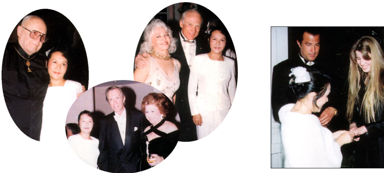
Rod Steiger, David Carradin, Diane Laad, Steven Seagal ...