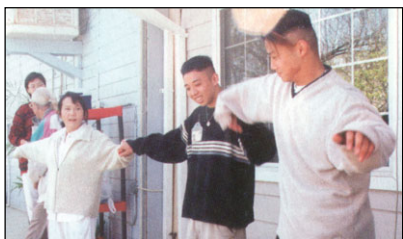
Žijící Mistryně a dva mladí spoluzasvěcení tancují.