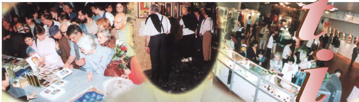
Fotografie z výstavy umělecké tvorby Nejvyšší Mistryně Ching Hai