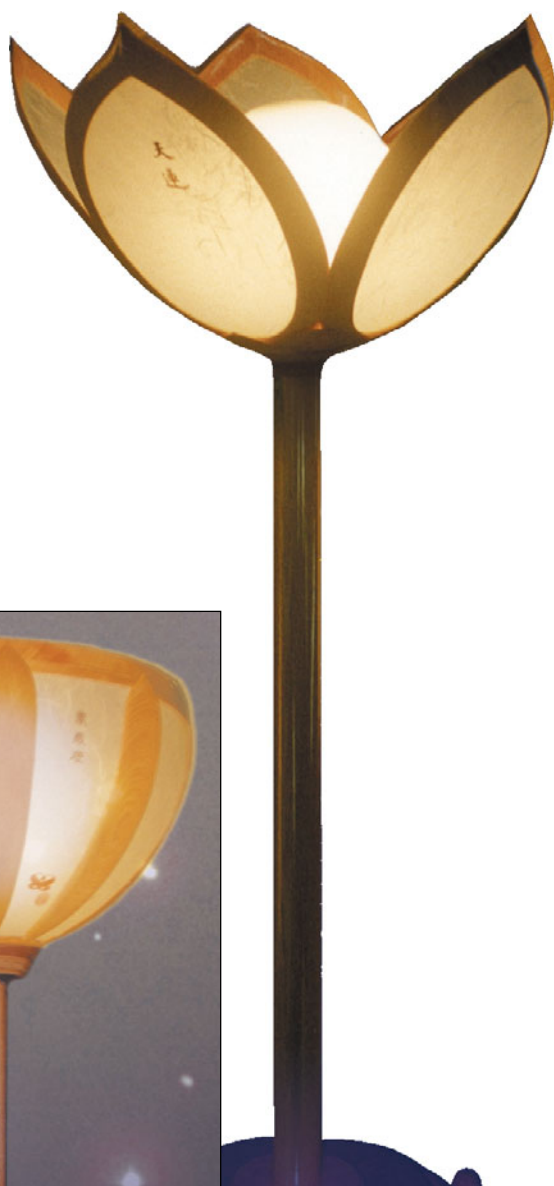
Návrhy osvětlení Nejvyšší Mistryně Ching Hai