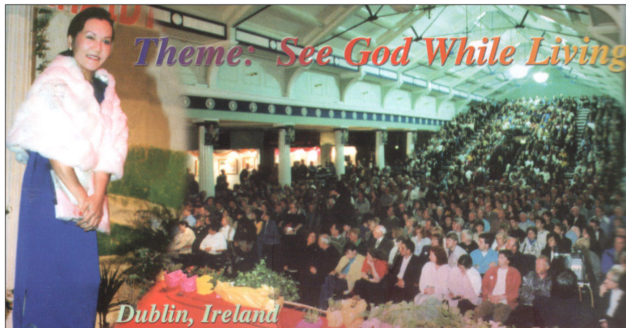
Z přednášky Nejvyšší Mistryně Ching Hai v Irsku na téma: „Poznat Boha v tomto životě“

Nebud'te skeptičtí ohledně přínosu skupinové meditace. Nepochybujte, že vám společné meditování přinese výhody. Nezatajujte přínos komunikace se spolupracujícími. Podobné přitahuje podobné. Je tam vzájemné povzbuzení a výživa, a my rosteme společně blízko sebe. To je jisté. Já musím být pilná a dát úsilí do toho, abych vyčistila své myšlenky, slova a skutky. Vy byste také měli být pilní a vyvinout úsilí, abyste vyčistili vaše myšlenky, slova a skutky. Tímto způsobem budeme mít vzájemné výhody. My určitě budeme mít přínos z toho, že se budeme stýkat jeden s druhým. (Obecenstvo tleská.)